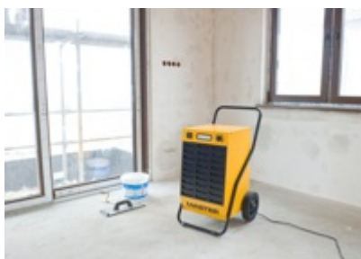
Строительные площадки со сложными условиями работы